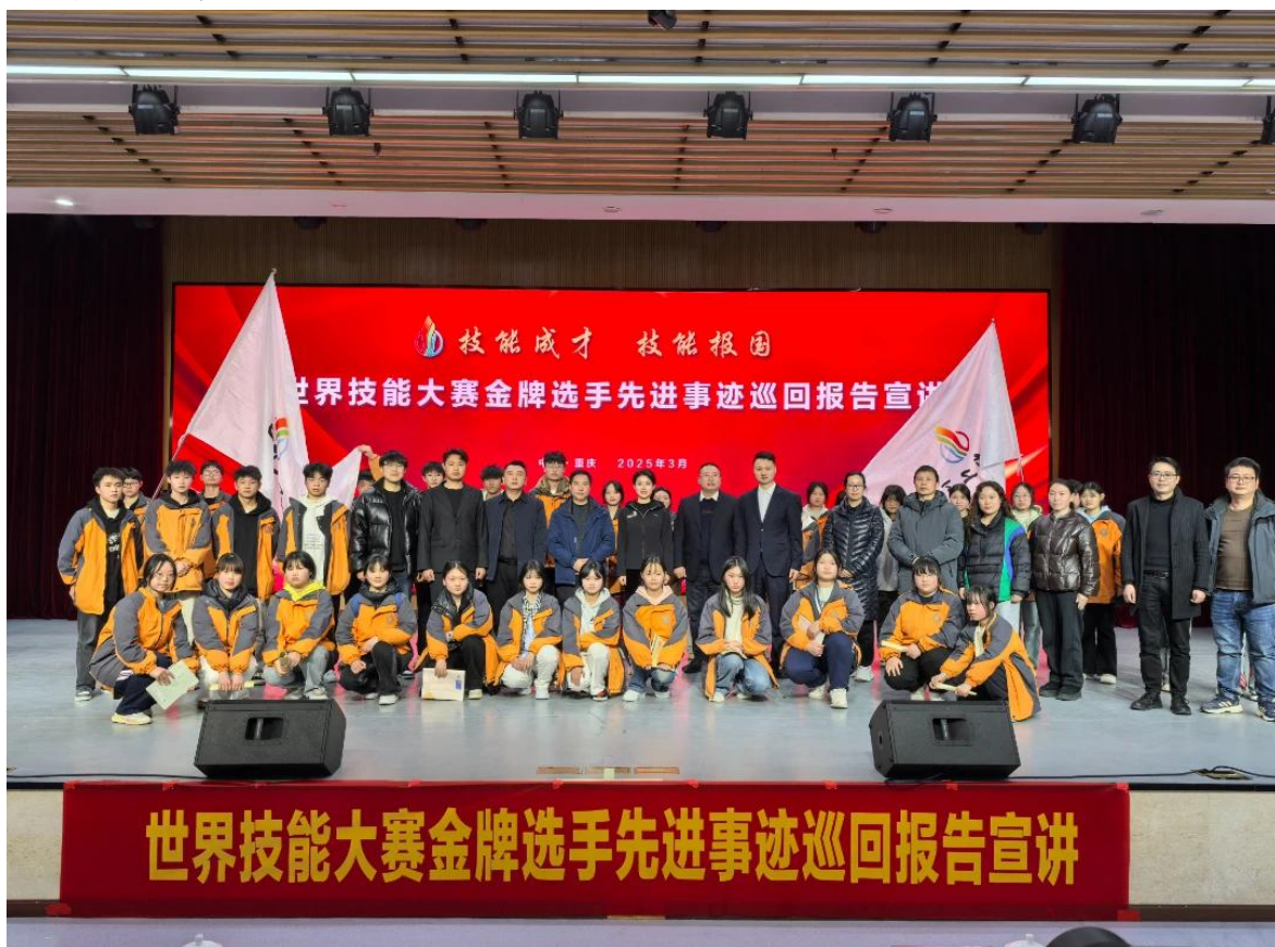
图5：世界技能大赛金牌选手先进事迹巡回报告会

84.5%，实现了技能学习与行业标准的有效对接。在技术技能人才培养创新举措上，构建“岗课赛证”综合育人体系，以岗位需求为导向，重构课程内容，将技能大赛标准、证书考核要求融入日常教学，形成相互促进的育人闭环。