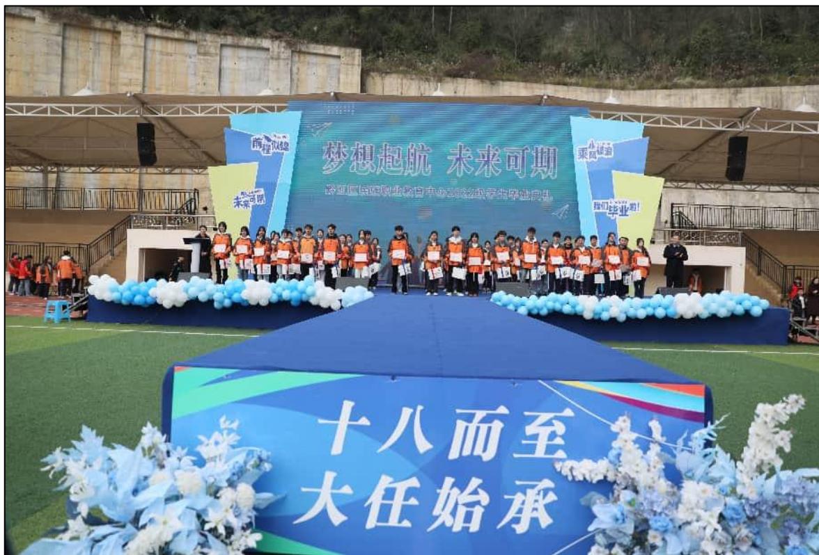
图2: 学生毕业典礼暨成人礼

等校外力量,形成专兼结合的育人团队。三是拓展课程思政内涵,实现专业育人融合。在原有“六维共育”体系基础上,新增“生态文明”与“数字素养”维度,形成“八维一体”思政教育框架。全面推动课程思政示范项目建设,新增校级示范课4-6门,力争新增市级项目1-2项。四是创新实践育人路径,增强思政教育实效。深化“五育并举”,将思政教育融入实习实训、技能竞赛。升级“三主”育人模式,依托武陵山红色资源与乡村振兴一线,开展融合性主题研学与实践10场次以上,让学生在体验中坚定信念、锤炼品格。