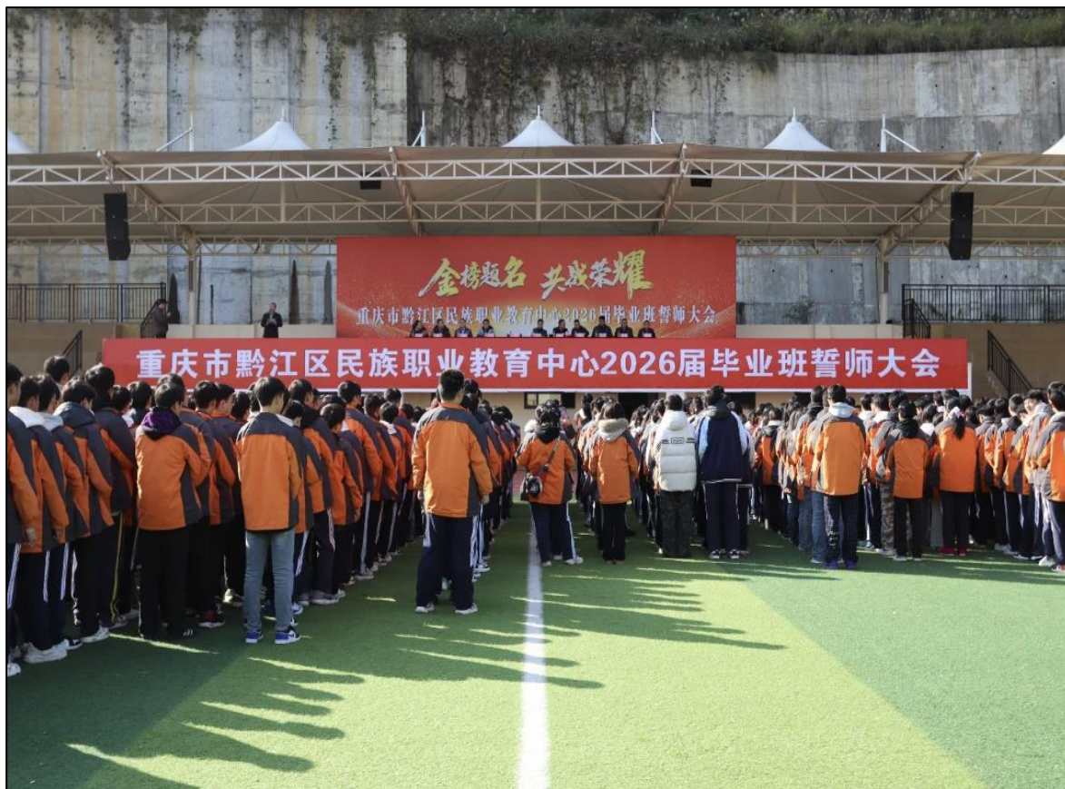
图6:2026届毕业班誓师大会

连续8年获全市第一名，计算机、电子、教育、机械类获全市专业类第一名，旅游专业类获全市第二名，机械、教育专业类获全市第三名，各专业类全市前10名我校共占18人。重庆师范大学我校录取24人。