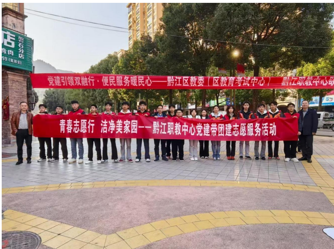
图10：党建带团建志愿服务活动