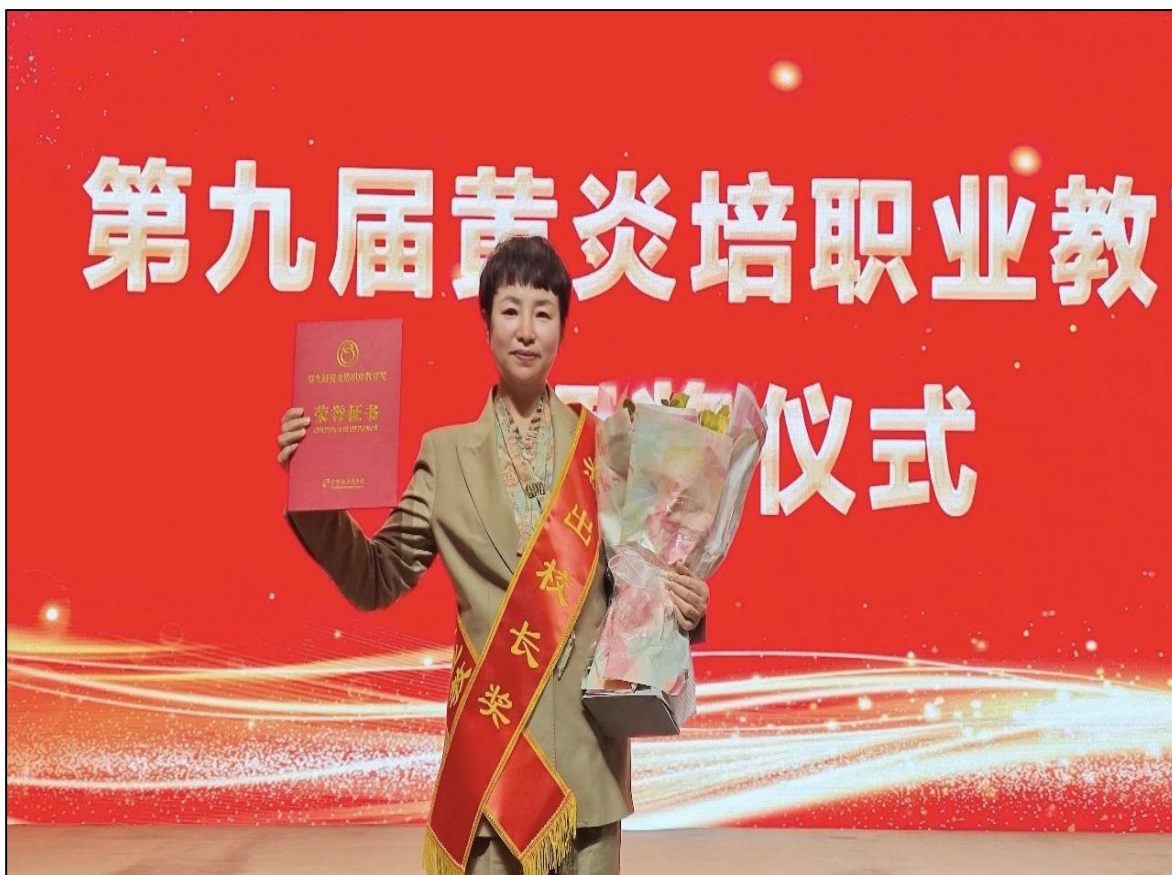
图4：获评第九届黄炎培职业教育杰出校长奖

学校深入贯彻落实中共中央国务院《关于全面深化新时代教师队伍建设改革的意见》、教育部等七部委《关于加强和改进新时代师德师风建设的意见》等文件精神，始终坚持“立德树人”根本任务，牢记为党育人、为国育才使命，实施“四力驱动”师德建设工程，以党建工作为引领，从制度建设着手，注重培根铸魂，强化榜样力量，合理运用考核评价结果，扎实推进师德师风建设落实落地，全面提升教师队伍思想政治和师德师风建设水平，为办好人民满意的教育提供了坚强保证。教师获评第九届黄炎培职业教育杰出校长奖，重庆市中华职业教育社杰出校长、非遗传承人，重庆市优秀教练员、优秀裁判员、黔江区优秀个人、“十佳宣讲员”等国市区级荣誉称号20余人次。教师荣获国家级赛事奖项3人次，市级赛事一等奖4项、二等奖17项、三等奖12项、优胜奖4项。