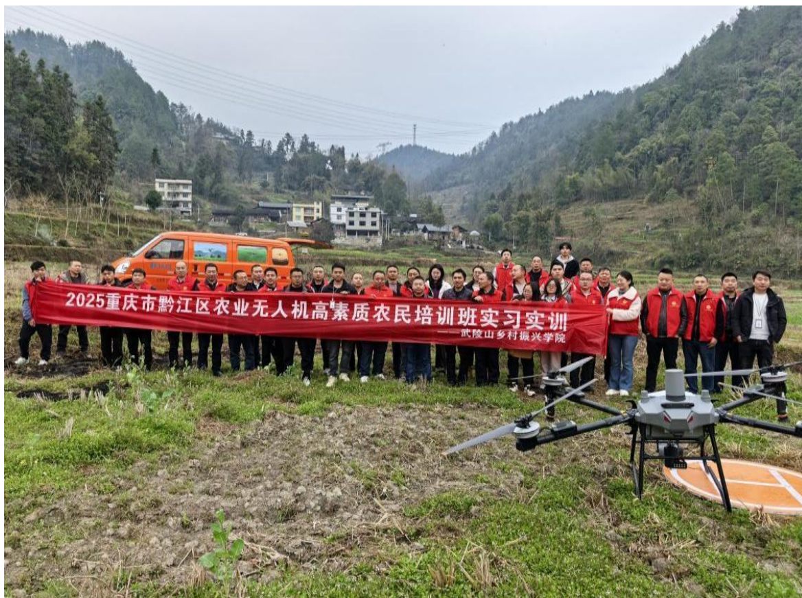
图7：开展农业无人机培训

护能力差、智能化应用不足等问题，设计了涵盖大中型拖拉机、联合收割机、植保无人机等设备的操作、维护与故障排查课程，并重点融入智能导航、变量作业、无人机遥感等新技术模块。培训采取“理论+模拟+田间实操”模式，依托校企合作资源，确保学以致用。近三年来，学院累计举办5期培训班，培训超过200人次。参训学员技能显著提升，带动企业农机作业效率平均提高20%，故障率下降30%以上。部分企业已成功引入无人机精量施药、自动驾驶播种等智能作业模式，实现降本增效。学院还建立学员跟踪机制与校企交流平台，提供持续技术咨询并推荐就业，形成“培训—赋能—输送”服务闭环。此举有效破解了地方涉农企业技术人才瓶颈，探索出职教服务乡村振兴的可复制路径。