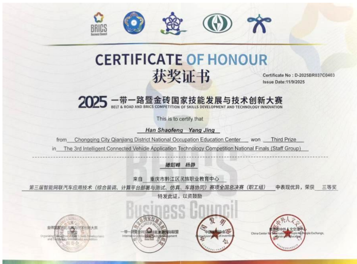
图9：一带一路暨金砖国家技能发展与技术创新大赛获奖证书

联合开发的《汽车底盘构造与拆装》国际课程资源，被市教委作为重庆市中职学校唯一推荐到教育部参评“具有国际影响力的职业教育资源”国际课程资源。